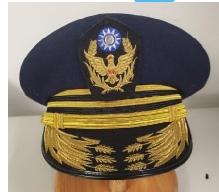
General commissioner , coiffe du Chief Secretary, National Police agency, Ministry of the Interior